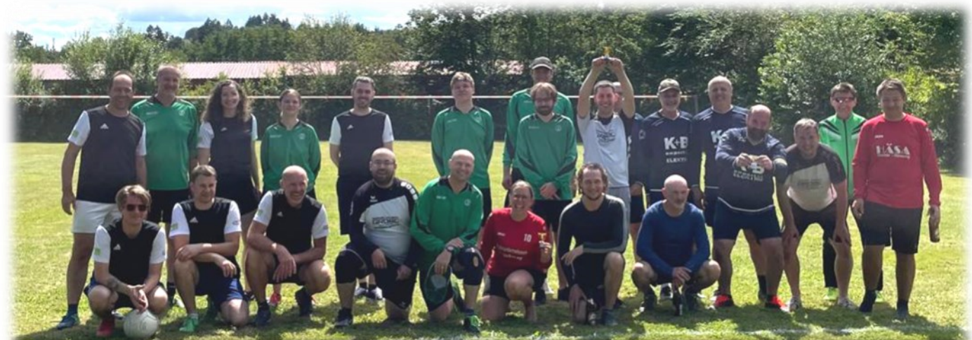
Niederbayerische Mannschaften beim Dachs-Pokal 2024 in Schwarzach