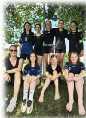
Die Siegermannschaft des Johann-Christian-Reinhart-Gymnasiums Hof der Altersklasse U14W mit ihrer Lehrerin