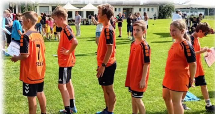
Die Siegermannschaft der Altersklasse U14M, Walter-Grobius-Gymnasium Selb bei der Siegerehrung