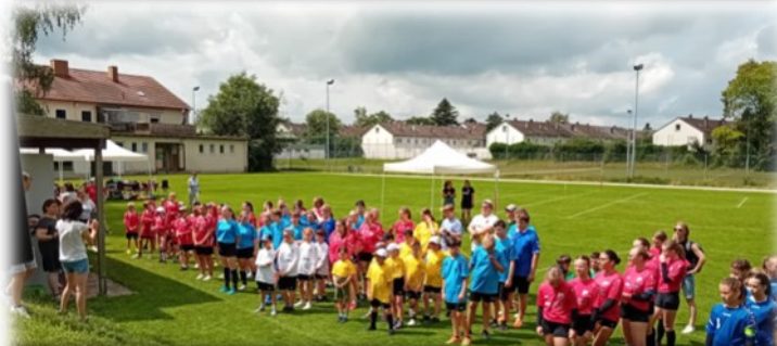
Begrüßung der 24 Mannschaften zum Bayerischen Schulsportfinale Faustball