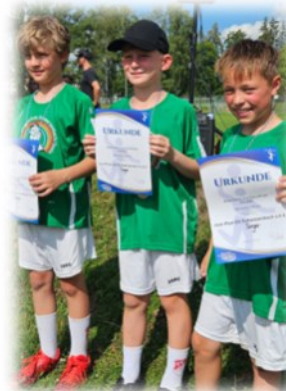
Das Sieger-Trio der U10mixed aus der Grundschule Schwarzenbach an der Saale