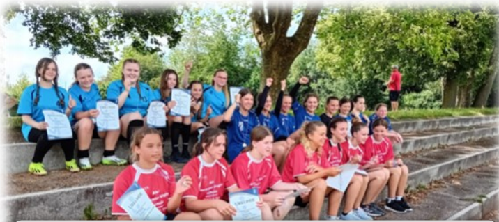
Die Mannschaften der Altersklasse U14W, von oben nach unten, Realschule Wunsiedel, Johann-Christian-Reinhart-Gymnasiums Hof und Abt-Hermann-Vogler-Schule aus Rot an der Rot