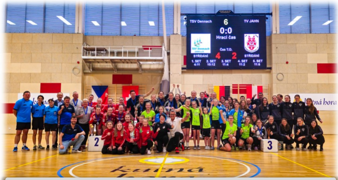
Gruppenfoto nach der Siegerehrung