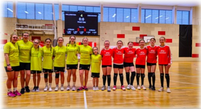
Die Hallersteinerinnen mit der Mannschaft aus Zdechovice