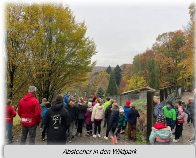
Abstecher in den Wildpark