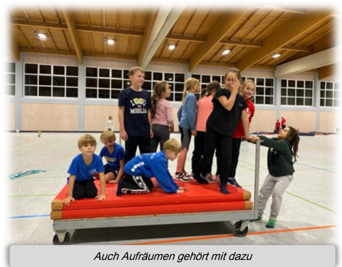
Auch Aufräumen gehört mit dazu

Dieses Wochenende zeigte Mal wieder eindrucksvoll, dass Faustball mehr ist als nur ein Sport: Es ist eine Gemeinschaft, die Spaß, Fairness und Teamgeist lebt. Die Kinder gingen mit neuen Freundschaften und tollen Erinnerungen nach Hause.