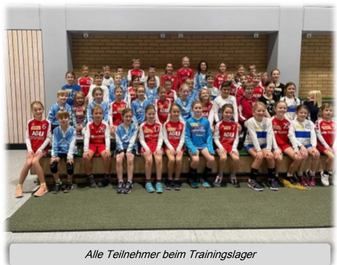
Alle Teilnehmer beim Trainingslager

Nachmittags wurde es wieder sportlich: In der Hohen Kreuz Halle stand noch ein Spieltag der U10 auf dem Programm, bei dem die jungen Talente zeigten, was in ihnen steckt und was sie am Vormittag dazu gelernt haben. Nach einem gemeinsamen Abendessen war dann noch lange nicht Schluss. In der Turnhalle gab's weiteren Faustball-Spaß und Spiele – kein Wunder, dass die Nacht kurz war!