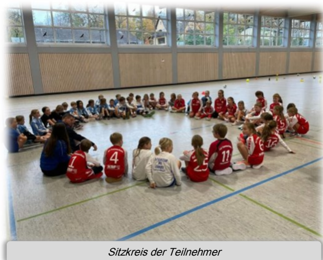
Sitzkreis der Teilnehmer

Das Wochenende startete locker: Kennenlernspiele brachten die Kids zusammen und sorgten für eine ausgelassene Stimmung. Schnell ging's dann aber ans Eingemachte – die Faustball-Basics standen auf dem Programm. In kleinen Gruppen wurde spielerisch an der Technik gefeilt, um dann wieder in der großen Gruppe das Gelernte Revue passieren zu lassen. Nach einem leckeren Mittagessen, für das das Team im Handballerheim nebenan sorgte, ging es für die Kids in den Haibacher Wildpark – perfekt, um sich zwischen den intensiven Trainingseinheiten zu entspannen und frische Luft zu schnappen.