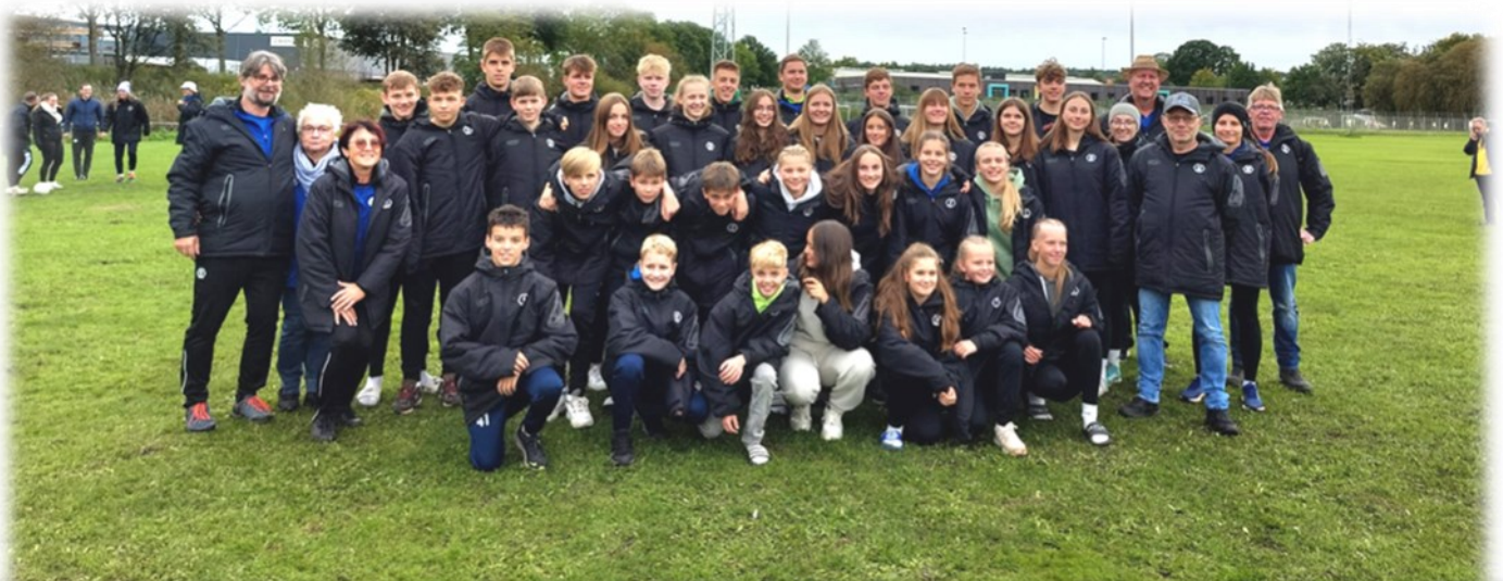
Die bayerische Delegation