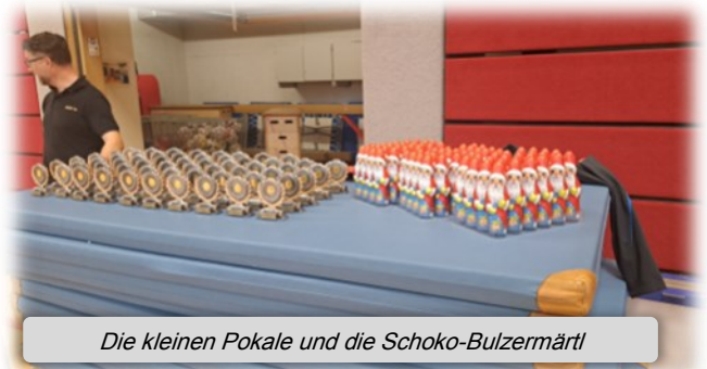
Die kleinen Pokale und die Schoko-Bulzermärtl

Bei der Siegerehrung gab es nebst den Urkunden für jeden Spieler*innen, auch einen kleinen Pokal, sowie einen Schoko-Bulzermärtl (eine fränkische Tradition am St. Martinstag 11.11.) als süße Ergänzung dazu.