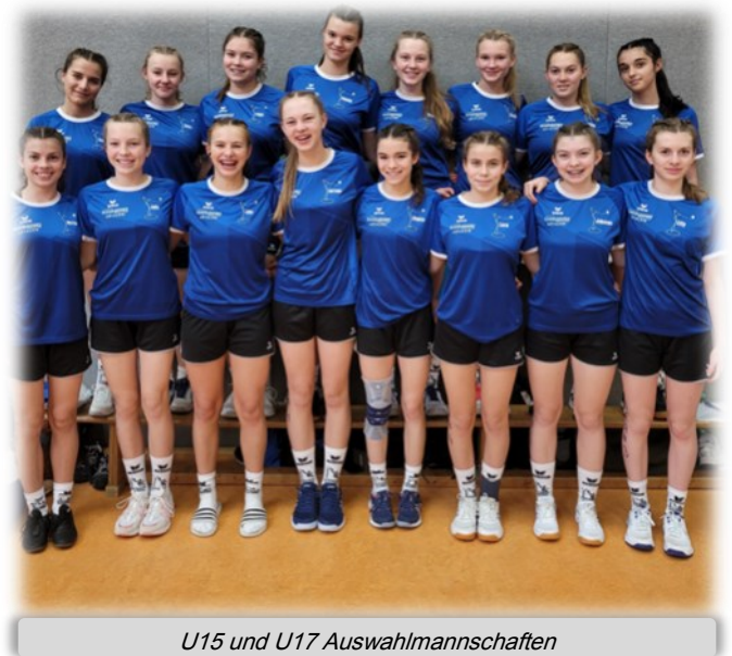
U15 und U17 Auswahlmannschaften

Nicht weniger spannend geht es in der Landesliga, in der Altersklasse der Frauen zu. Mit noch einem ausstehenden Vorrundenspieltag, scheint der VfL Niederwerrn sich die Vorrundenmeisterschaft zu holen. Chancen auf Platz zwei haben mit der DJK Schweinfurt, dem TSV Lendershausen und dem TSC Zeuzleben noch drei Mannschaften. In der Jugend 19 steht der TSV Bergheinfeld ungeschlagen auf Platz eins. Um Platz zwei wird auch hier noch ein von drei Mannschaften geführter Kampf ausgetragen. In der Jugend 15 wird der letzte Vorrundenspieltag die beiden Spitzenpositionen entscheiden. Die Möglichkeit hierzu haben derzeit mit Bergheinfeld, Nordheim, Schonungen und Hambach vier Mannschaften. Die Rückrunde verspricht demnach in allen Altersklassen und Ligen extrem viel Spannung und es bleibt abzuwarten, wer sich die Tickets für die bayerischen Meisterschaften erspielt.