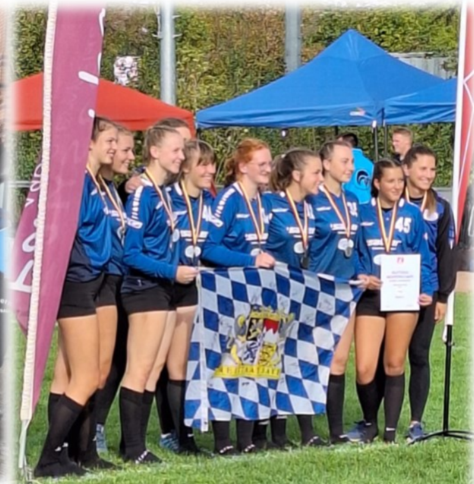
Gewinn der Silbermedaille