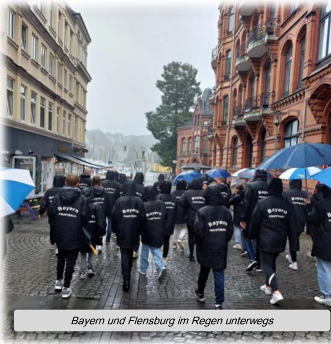
Bayern und Flensburg im Regen unterwegs