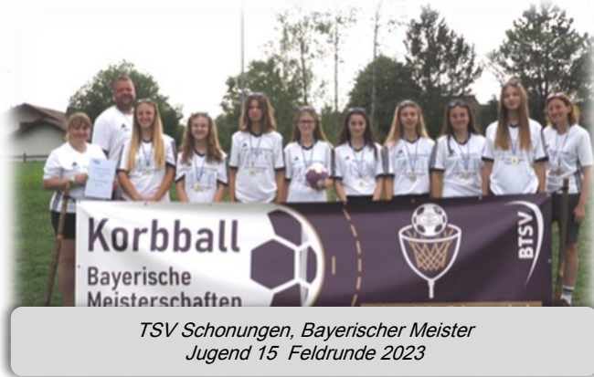
TSV Schonungen, Bayerischer Meister Jugend 15 Feldrunde 2023

erischen Meisterschaften. Wie in den Vorjahren dominierten die unterfränkischen Teams die bayerischen Titelkämpfe. Lediglich in der Jugend 15, konnte neben der Goldmedaille, keine Silbermedaille geholt werden.