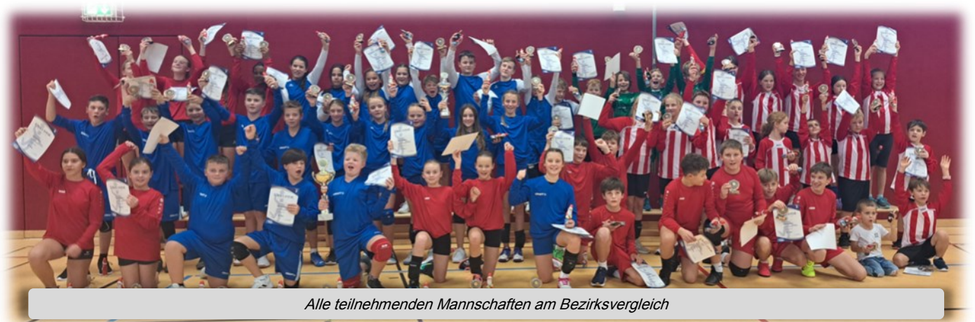
Alle teilnehmenden Mannschaften am Bezirksvergleich