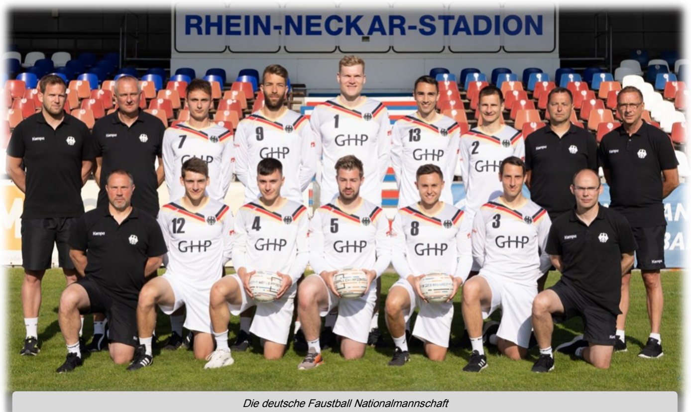
Die deutsche Faustball Nationalmannschaft