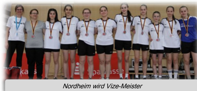
Nordheim wird Vize-Meister