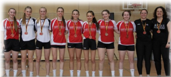
Bergheinfeld holte sich den 3. Platz