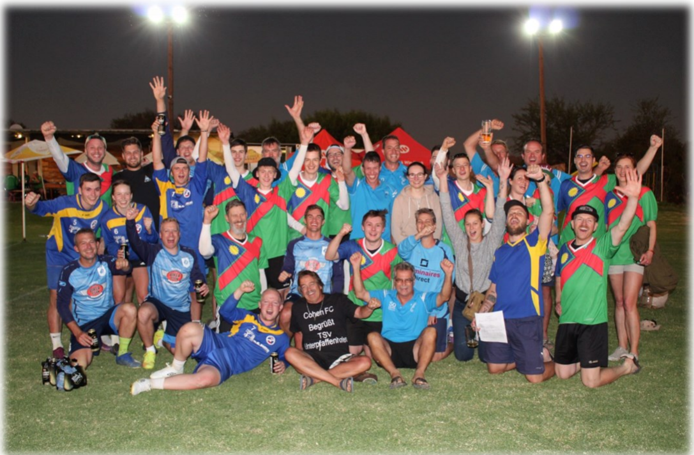
Foto mit Spielern des TSV UG und aus Namibia