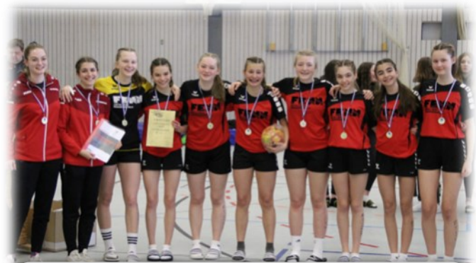
TSV Bergheinfeld J15

Erstmalig auch bei den nationalen Titelkämpfen dabei sein wird der TSV Nordheim. In Marktoberdorf war die Mannschaft zunächst noch sehr nervös aufgetreten, hatte sich aber mit starker Abwehrleistung ein 1:1 gegen