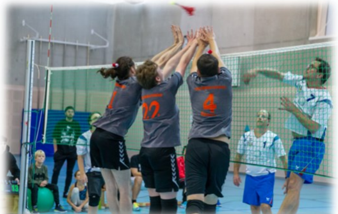
Finale: Angriff „Amperland Turnier“ (rechts) gegen Dreierblock „Milbertshofen mit Benno“ (links)

nur um wenige Ballpunkte. „Reichertshausen Kids“ (verstärkt mit älteren Spielerinnen und Spielern) hatte es nicht leicht, lies aber immerhin „Amperland Kids“ hinter sich. Die „Reichertshausen Ladies“ kämpften zu viert, wurden aber in der ersten Runde von Amperland und Milbertshofen auf den dritten Platz verdrängt. Somit war nur noch die Trostrunde und damit maximal Platz sieben möglich. Diesen verteidigten sie aber vehement. „Reichertshausen Turnier“ schaffte es bis ins Halbfinale, zog dort aber gegen den späteren Sieger „Milbertshofen mit Benno“ den Kürzeren und belegte Platz drei.